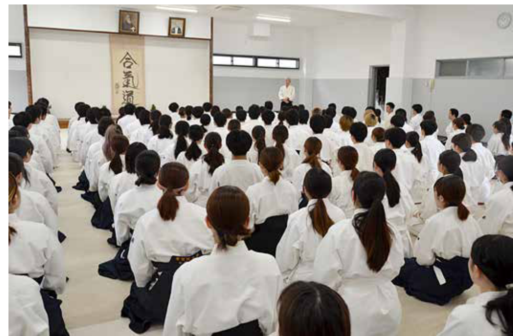
Il y a de plus en plus de femmes qui pratiquent l'Aïkido, et de plus en plus de femmes instructeurs au Hombu Dojo.

qu'il enseignait. Mais c'est aussi là que Kisshōmaru, le second Dōshu, a enseigné. Et c'est à partir de cet enseignement que de nombreux pratiquants se sont formés. Ils sont ensuite devenus instructeurs, ont parcouru le monde et ont fait connaître l'aïkido dans de nombreux endroits. Maintenant, en quelque sorte, leurs étudiants, qui connaissent et apprécient l'aïkido, reviennent à la source. Ils veulent découvrir « de leurs propres yeux » tout ce que le Hombu Dojo représente en tant que berceau et centre mondial de l'aïkido.