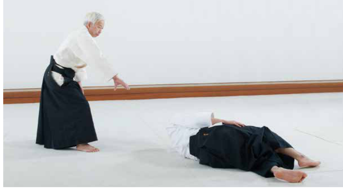
Shomen-Uchi Irimi-Nage Il s'agit de l'une des techniques les plus représentatives de l'aïkido. Tori est face à Uke. À l'instant où Uke lève sa main-sabre pour frapper shomen, Tori avance profondément son pied arrière dans le dos de Uke et prend le contrôle de son cou et de sa main. Tori déséquilibre Uke avec un mouvement tenkan. Tori amène Uke sur son épaule et lève le bras. Tori avance fortement son pied arrière et projette Uke en descendant le bras.

évolution de l'esprit qui se produit au fur et à mesure des entraînements. Quand Kisshōmaru Dōshu a ouvert l'aïkido au grand public, il a déclaré que ce que nous développons au dojo, nous devons le redonner d'une façon ou d'une autre dans la société. Respecter les autres, être capable de s'adapter aux personnes