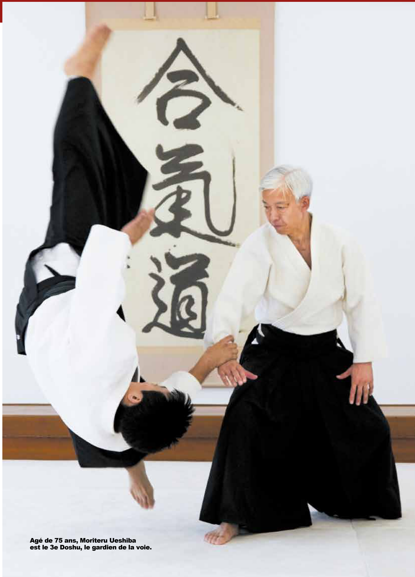
Agé de 75 ans, Moriteru Ueshiba est le 3e Doshu, le gardien de la voie.

L'aïkido n'a pas une approche orientée vers la victoire. Il ne s'agit pas d'essayer de gagner, mais plutôt d'essayer de travailler ensemble. Pendant et à travers la pratique, au fil des entraînements, l'intention est de développer à la fois le corps et l'esprit. La spécificité majeure de l'aïkido est donc qu'il n'y a pas de compétition, vous n'essayez pas de battre les autres.